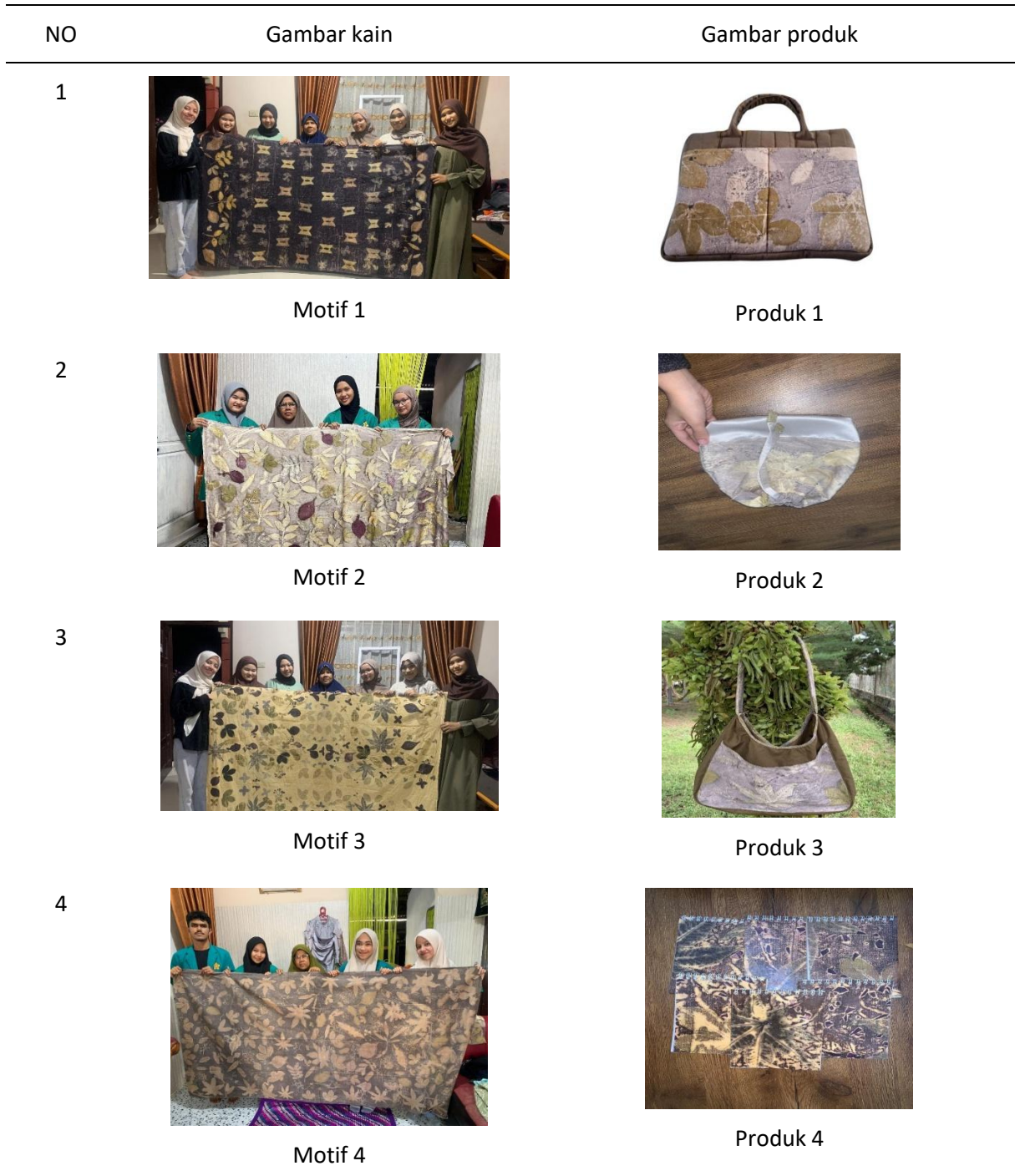
Tabel 1. Motif dan Produk yang Dihasilkan

ketertarikan, di samping keunikan motif. Keunggulan ini menunjukkan bahwa ecoprint memiliki nilai ekonomi, estetika, dan ekologis yang kuat.