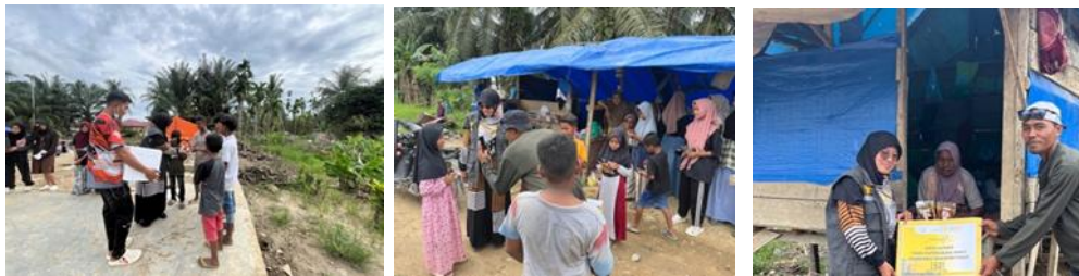
Gambar 5 Sasaran Kegiatan

Temuan ini sejalan dengan Yusuf dan Abdullah (2021) yang menyatakan bahwa modal sosial dan solidaritas masyarakat merupakan faktor penting dalam keberhasilan program kemanusiaan berbasis komunitas.