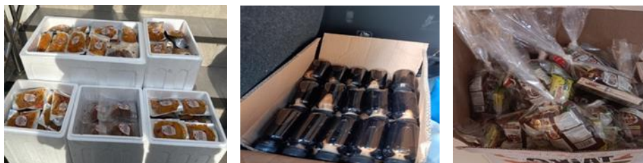
Gambar 3 Jenis Bantuan

memerlukan adaptasi dalam proses konsumsi. Madu berfungsi sebagai pelengkap bantuan karena mengandung energi alami yang mudah diserap tubuh dan dapat dikonsumsi secara langsung. Kombinasi rendang dan madu memberikan alternatif bantuan pangan yang tidak hanya praktis tetapi juga memiliki nilai gizi yang baik.