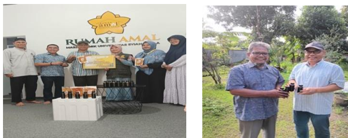
Gambar 4 Bentuk Kolaborasi ISEI dan Rumah Amal USK

Sementara itu, Rumah Amal USK berperan sebagai lembaga filantropi kampus yang membantu proses penggalangan dana, koordinasi di lapangan, serta distribusi bantuan. Kolaborasi kedua lembaga ini menunjukkan pentingnya sinergi antara organisasi profesi dan perguruan tinggi dalam mendukung pembangunan sosial masyarakat.