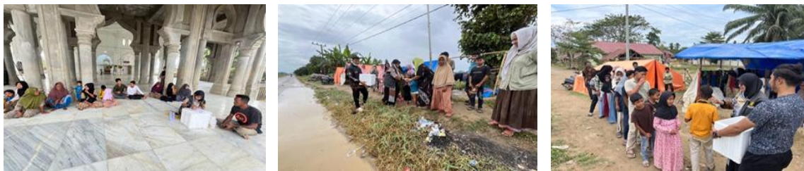
Gambar 1 Kegiatan Masyarakat di Langkahan

Kabupaten Aceh Utara merupakan salah satu wilayah di Provinsi Aceh yang memiliki tingkat kerentanan tinggi terhadap banjir. Banjir yang terjadi pada akhir tahun 2024 hingga awal tahun 2025 menyebabkan ribuan masyarakat terdampak, kerusakan rumah penduduk, terganggunya aktivitas ekonomi, serta menurunnya kemampuan masyarakat dalam memenuhi kebutuhan dasar sehari-hari. Beberapa wilayah, seperti Kecamatan Langkahan, Muara Batu, dan Sawang, mengalami dampak yang cukup serius sehingga membutuhkan perhatian dan bantuan dari berbagai pihak.