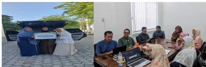
Gambar 1 Koordinasi dan identifikasi kebutuhan lapangan

hamil, ibu menyusui, dan lansia. Pelaksanaan kegiatan dilakukan melalui empat tahapan utama, yaitu koordinasi, penyortiran bantuan, distribusi bantuan, serta monitoring dan evaluasi.