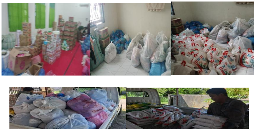
Gambar 2. Pengumpulan, penyortiran, dan pengemasan bantuan

Bantuan dikelompokkan menjadi beberapa kategori, yaitu: bantuan pangan, pakaian layak pakai, perlengkapan kebersihan diri, perlengkapan bayi, perlengkapan anak, perlengkapan ibadah, dan kebutuhan pendukung lainnya. Selanjutnya, bantuan dikemas dalam bentuk paket agar mudah didistribusikan melalui posko dan perangkat gampong.