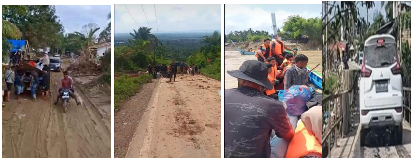
Gambar 5 Akses Menuju Lokasi

Namun demikian, kendala tersebut tidak mengurangi manfaat program dalam mendukung pemenuhan kebutuhan dasar masyarakat terdampak banjir.