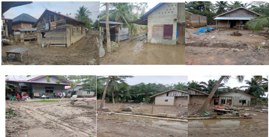
Gambar 4 Monitoring dan Evaluasi

Tahap keempat adalah monitoring dan evaluasi kegiatan. Monitoring dilakukan selama proses distribusi untuk memastikan bantuan tersalurkan sesuai sasaran. Evaluasi dilakukan setelah kegiatan selesai dengan memperhatikan jumlah bantuan yang terkumpul, jumlah posko yang menerima bantuan, jumlah penerima manfaat, kesesuaian bantuan dengan kebutuhan masyarakat, kendala distribusi, serta rekomendasi perbaikan untuk kegiatan berikutnya. Evaluasi ini penting agar kegiatan pengabdian tidak hanya bersifat karitatif, tetapi juga menjadi pembelajaran kelembagaan dalam memperkuat tata kelola logistik kemanusiaan.